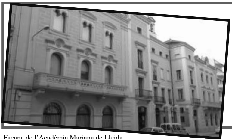
Façana de l'Acadèmia Mariana de Lleida