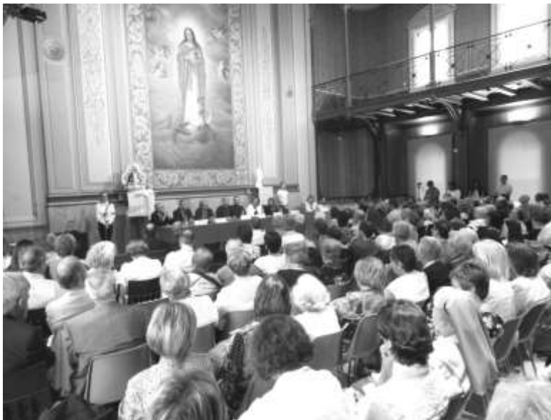
Panoràmica del Paranimf durant la realització del certamen del 2019

2008 com a patrona del Col·legi Episcopal, en el seu 50è aniversari de la fundació del col·legi 2012 pel 150è aniversari de la fundació de l'Acadèmia.