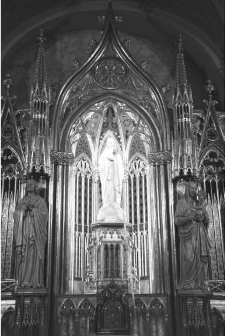
La Mare de Déu de l'Acadèmia a l'oratori de l'Acadèmia Mariana de Lleida.