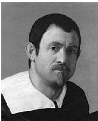
Giovanni Battista Salvi, el Sassoferrato; autorretrat

Un dels artistes italians més copiats va ser Giovanni Battista Salvi (Sassoferrato, Ancona, Las Marcas, 1609 - Roma, 1685). Conegut amb el sobrenom del Sassoferrato en referència al seu lloc de naixement.