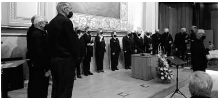
L'Schola Cantorum de Lleida en diferents moments de la seva aportació.