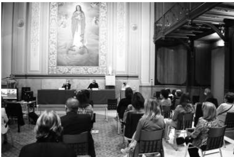
Aspecte del Paranimf de l'Acadèmia Mariana amb l'aforament màxim permès de cinquanta persones. S'ha d'observar el petit estudi per a emetre i enregistrar el certamen pel canal de YouTube.