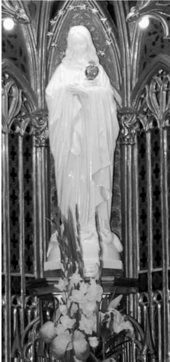
La Verge Blanca de l'Acadèmia, patrona de Lleida.