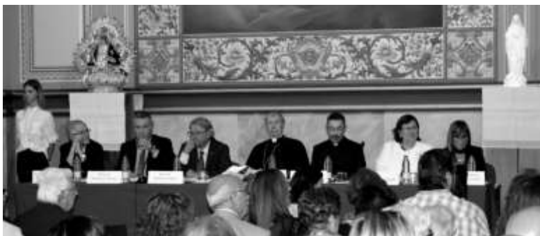
Presidència del Certamen Marià de l'any 2019.