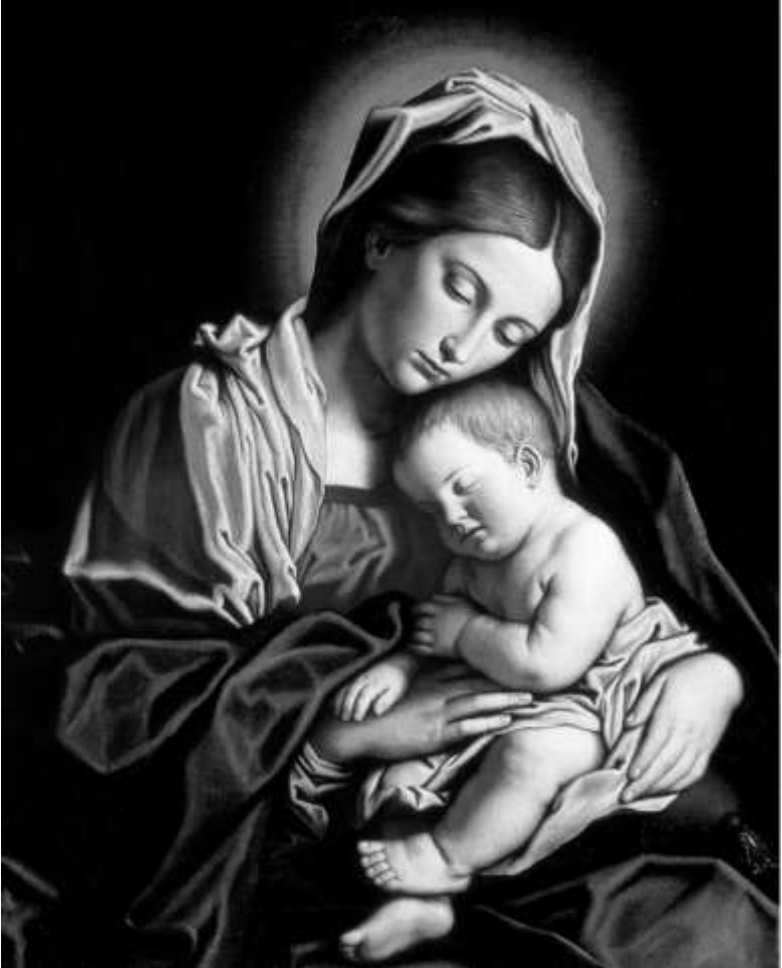
Verge amb el Nen adormit. Giovanni Battista Salvi, el Sassoferrato; Palazzo Ducale, Urbino, Itàlia