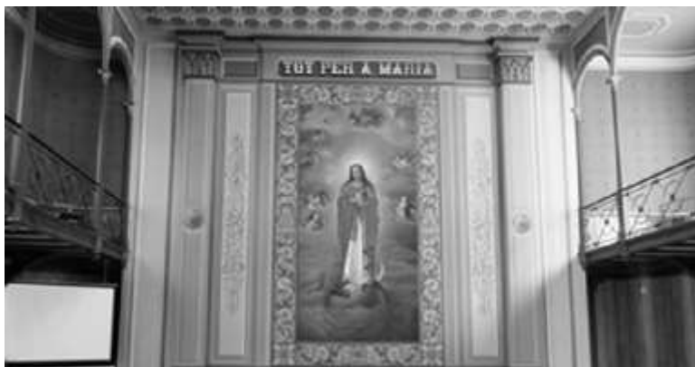
Claustre de l'Acadèmia Mariana (a dalt) i frontal del paraninf (a baix).