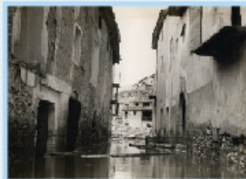
El carrer Major poc després de la inundació.