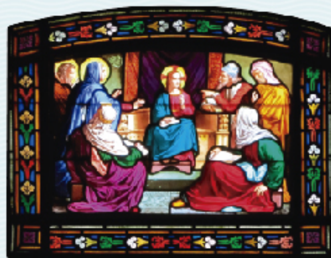
Taller Bazin-Latteux, 1876. Oratori de la Verge Blanca de l'Acadèmia, esquerra.

“Per què em buscàveu? No sabíeu que jo havia d’estar a casa del meu Pare? ... La seva mare conservava tot això en el seu cor.” (Lc 2,51)