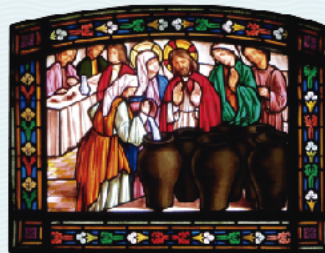
Taller Gns. Navarro, 1969 . Substitueix l'original de l'Adoració dels Mags, destruït. Oratori de la Verge Blanca de l'Acadèmia, esquerra.