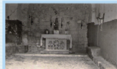
Interior de l'ermita de la Mare de Déu del Castell, restaurada el 1950.