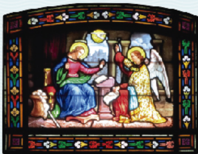
Taller Bazin-Latteux, 1876. Oratori de la Verge Blanca de l'Acadèmia, dreta.

“Alegra’t, plena de gràcia. El Senyor és amb tu.” (Lc 1,28)