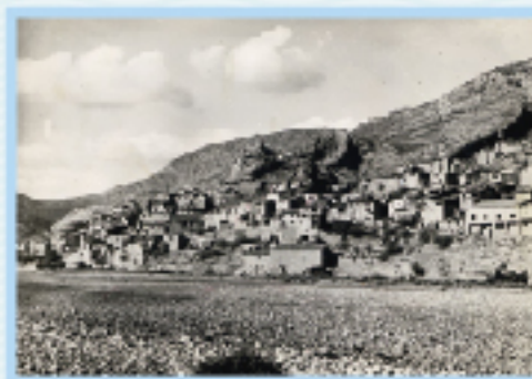
Tragó de Noguera abans de la inundació.

Tragó de Noguera, 50 anys sota les aigües del pantà de Santa Anna (1962-2012)