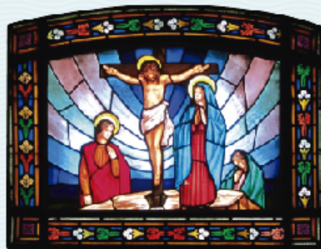
Taller Gns. Navarro, 1969. Substitueix l'original de la Presentació de Jesús, destruït. Oratori de la Verge Blanca de l'Acadèmia, esquerra.

“Jesús digué a la mare: Dona, aquí tens el teu fill. Després digué al deixeble: Aquí tens la teva mare.” (Jn 19, 26-24)