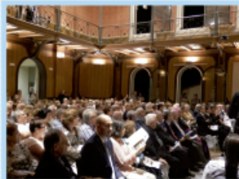
El Paranimf de l'Acadèmia Mariana, durant el Certamen.