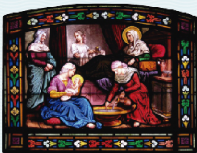
Taller Bazin-Latteux, 1876. Oratori de la Verge Blanca de l'Acadèmia, dreta.

“Qui és aquesta que guaita com l’aurora, bella com la lluna, resplendent com el sol?” (Ct 6,10)