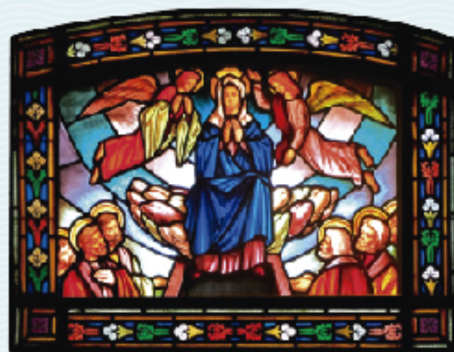
Taller Gns. Navarro, 1952. Oratori de la Verge Blanca de l'Acadèmia, esquerra.

“Acabat el curs de la seva vida a la terra, Maria va ser duta en cos i ànima a la glòria del cel.” (Lumen Gentium, 59)