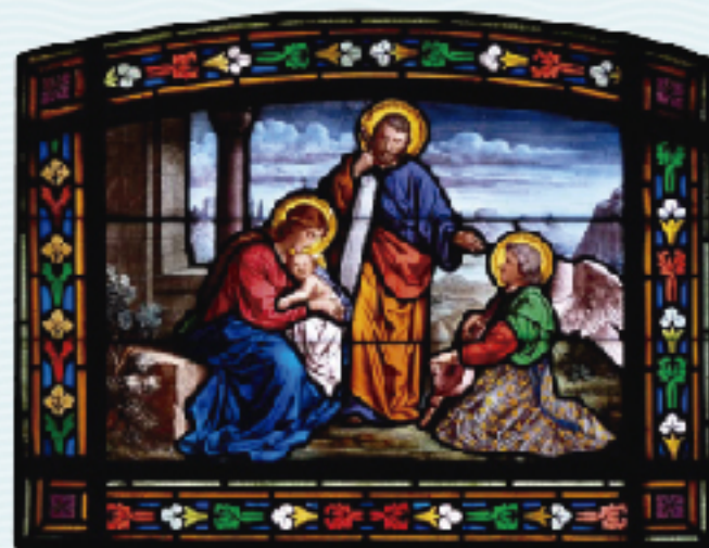
Taller Bazin-Latteux, 1876. Oratori de la Verge Blanca de l'Acadèmia, esquerra.

“Jesús, Maria i Josep, Santa Família de Natzaret, en vosaltres contemplem la bellesa de la comunió en el veritable amor.” (Papa Francesc, 27.10.13)