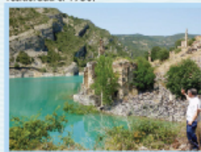
El pantà de Santa Anna i el poble en ruïnes.