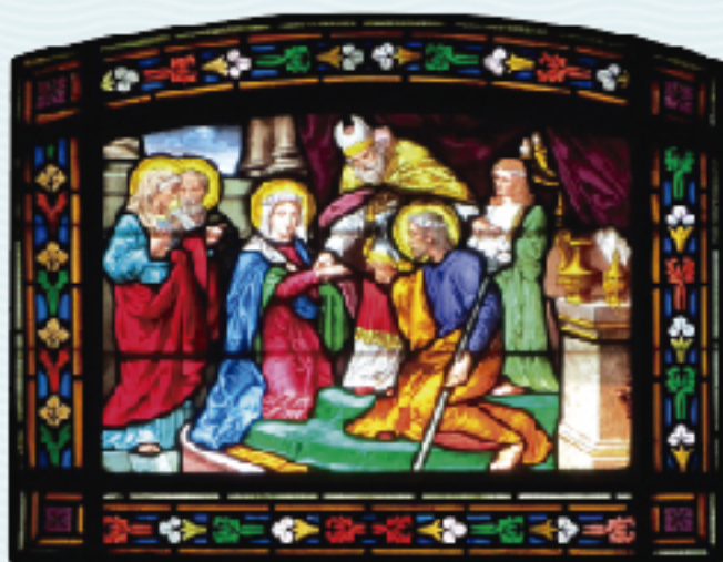
Taller Bazin-Latteux, 1876. Oratori de la Verge Blanca de l'Acadèmia, dreta.

“Josep, fill de David, no tinguis por de prendre Maria, la teva esposa, a casa teva: el fruit que ella ha concebut ve de l'Esperit Sant.” (Mt 1,20)