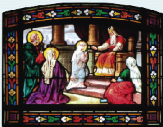
Taller Bazin-Latteux, 1876. Oratori de la Verge Blanca de l'Acadèmia, dreta.

“La verge concebrà i tindrà un fill, i li posaran el nom d’Emmanuel, que vol dir «Déu amb nosaltres».” (Mt 1,23)