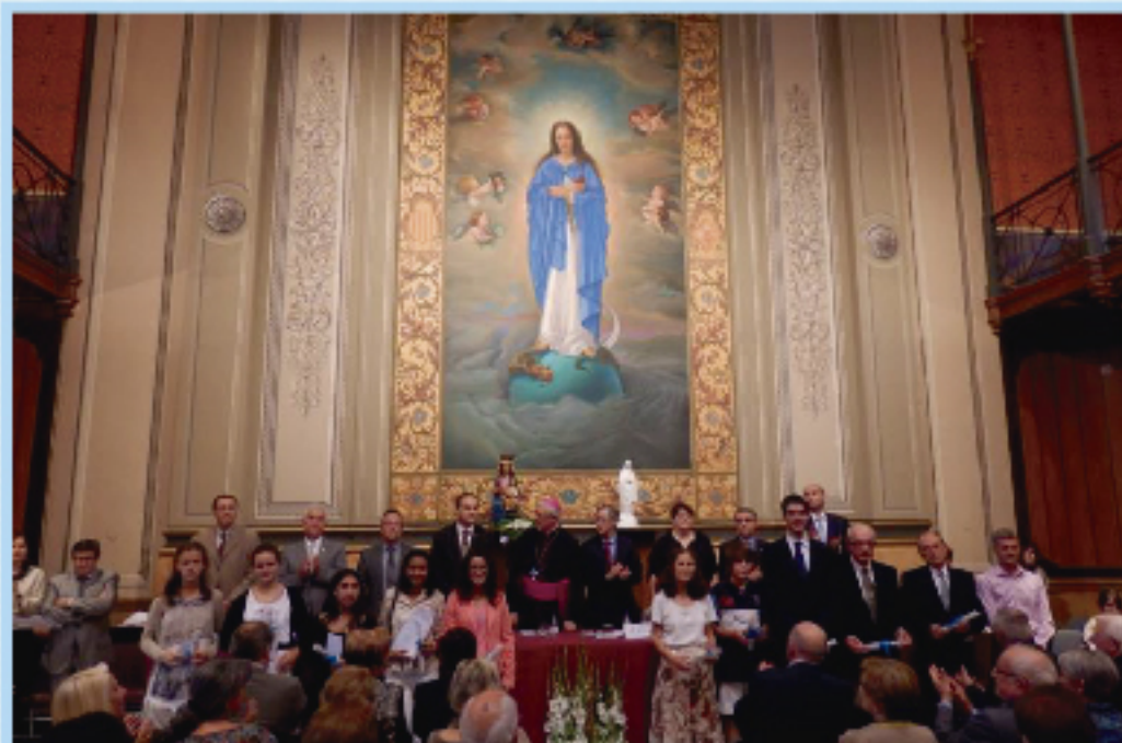
Els guardonats del Certamen amb les autoritats.