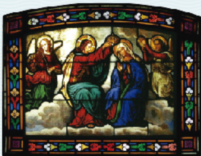
Taller Bazin-Latteux, 1876. Oratori de la Verge Blanca de l'Acadèmia, esquerra.

“Teniu la reina a la dreta, vestida amb brocats d’or.” (Sl 44)