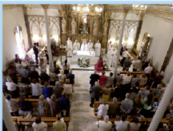
L'Oratori amb els fidels durant l'Eucaristia.