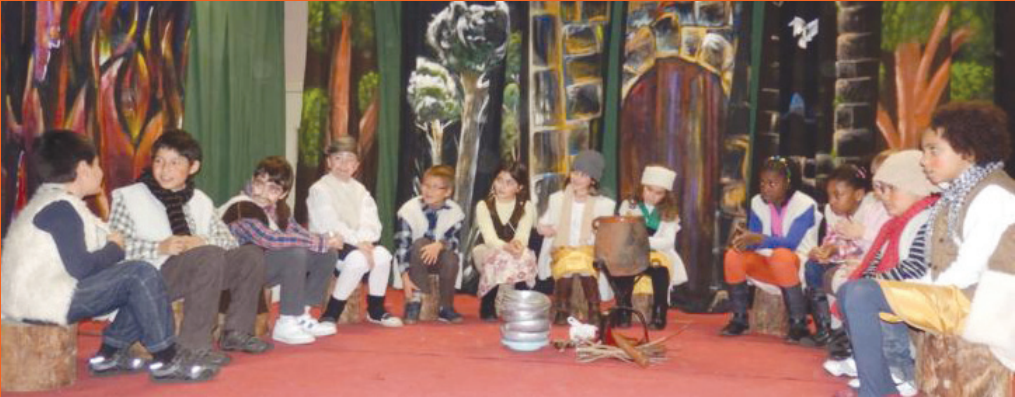
Els pastorets infantils: el millor pessebre.