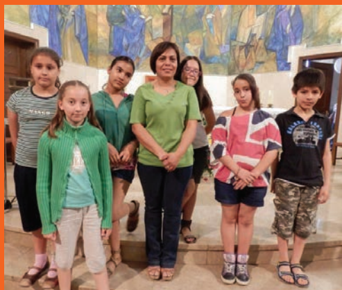
Mes de maig, mes de Maria.