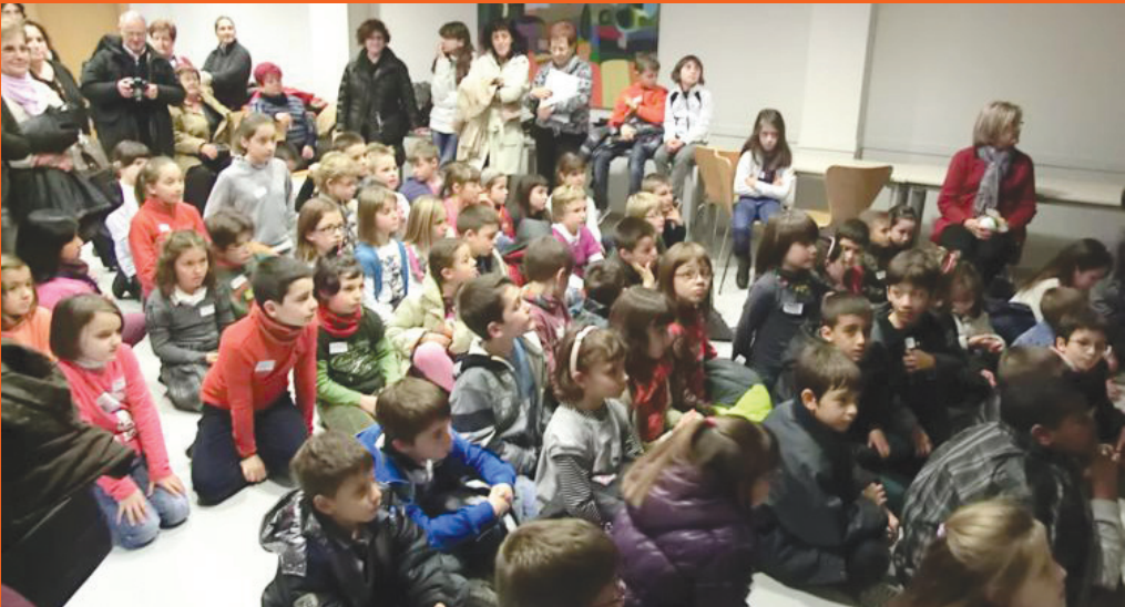
Amèrica en la Fira de la Infància Missionera.