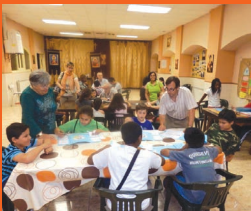
Fi de curs.