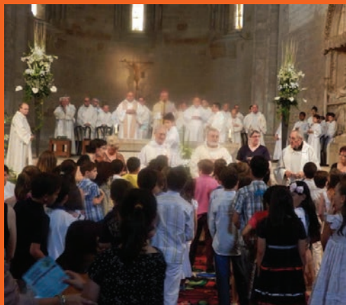
Corpus Christi a la Seu Vella.