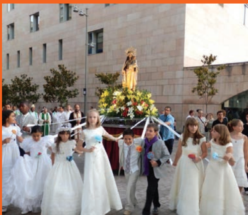
Processó del Carme.