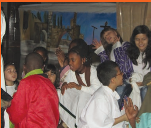
La representació de la Passió, Divendres Sant.