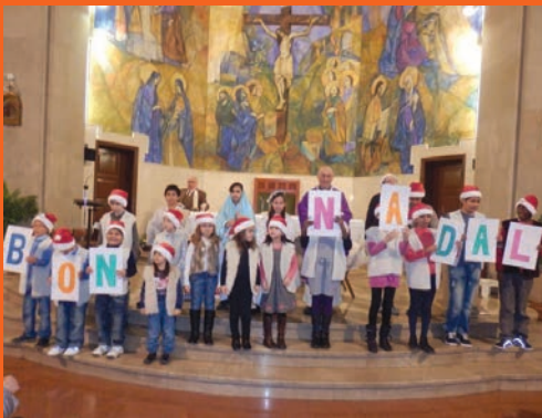
Ofrena dels pastors al Nen Jesús i felicitació de Nadal.