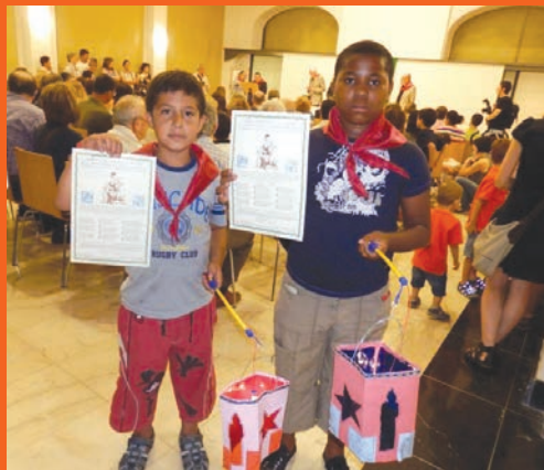
Romeria i fanalets de Sant Jaume