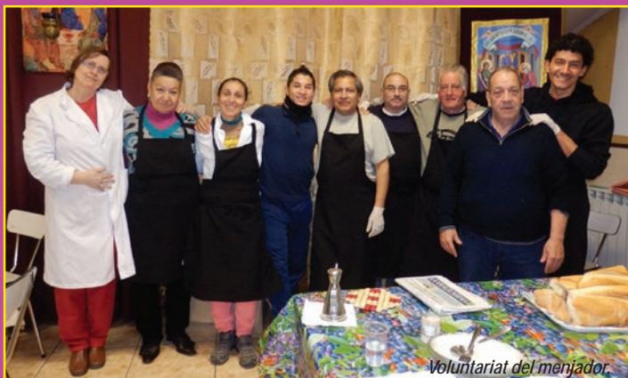
Voluntariat del menjador.

JERICÓ, Un paraigua que aixopluga diferents projectes i desvetlla generositat