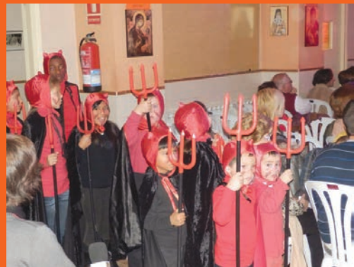
Les fúries de l'infern, a Borrego i Carquinyoli: uns dimoniets molt «bons».