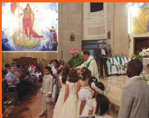
Imposició de l'Escapulari als nens i nenas de Primera Comunió.