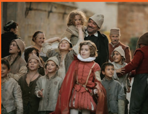
«Prefiero el Paraíso». El grup d'escolans va anar a veure la pel·lícula que commou i genera sentiments de bondat.