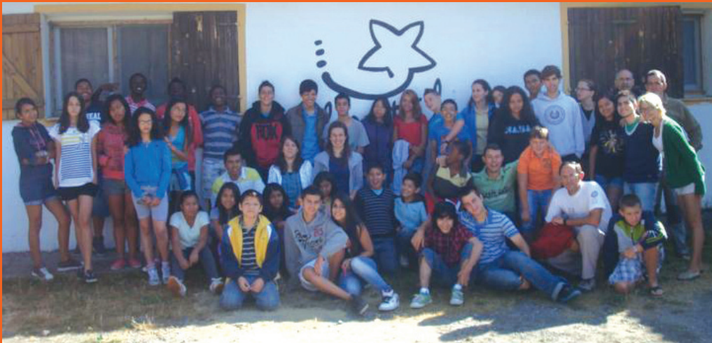
Campaments d'estiu a l'Estel - Senet-Aneto.