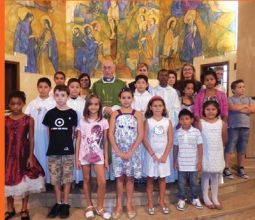
Celebració d'inici de curs de la catequesi.