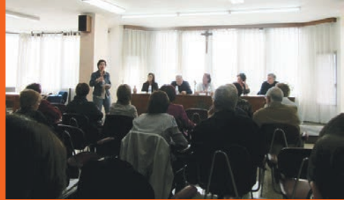
Itinerari catequètic de formació dels pares. Taula rodona en la jornada de formació de catequistes organitzada per la Delegació de Catequesi.