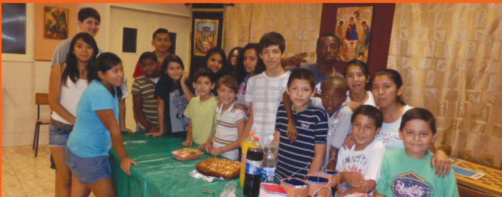
Esplai d'estiu. Tallers.