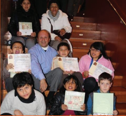
Lliurament de premis del Concurs de pessebres.