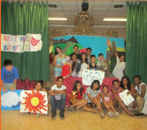
Esplai d'estiu. Teatre.