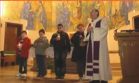
«Dimarts» de Cendra.