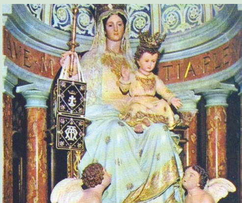
Mare de Déu del Carme - Muntanya del Carmel.