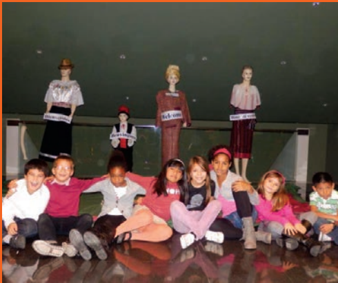
Festival solidari. Jericó