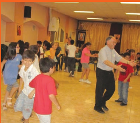
Festa de catequesi.