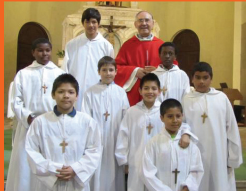
Diumenge de Rams a Sant Joan.