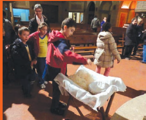
Preparació del Nadal.