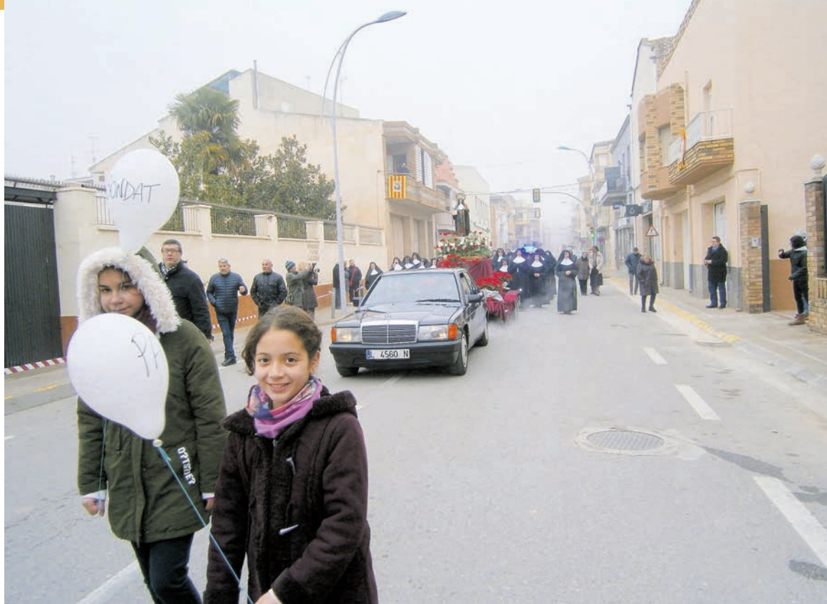
Fins a 200 infants de les escoles donaren la benvinguda a la santa amb globus.