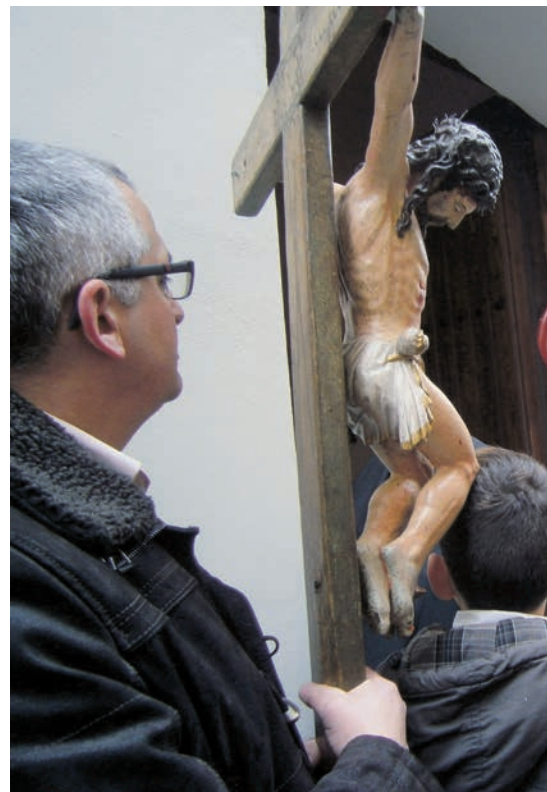
En el moment de beneir la recuperada i restaurada imatge de la santa.

Tot seguit la imatge de la santa, entre aplaudiments i l'emoció de