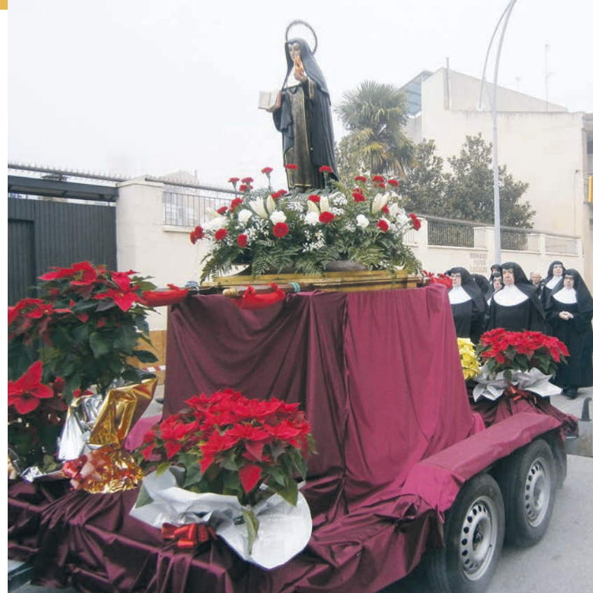
La imatge de santa Teresa Jornet entra a Aitona acompanyada per les seves germanetes.