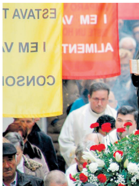
La santa en processó pel carrer que porta el seu nom.