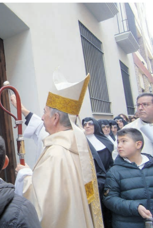
ada casa asil fundada per la santa.

La reforma inclou espais audiovisuals que ajuden a comprendre la història d'aquest edifici des de la seva fundació fins al 1980, data en la qual les germanetes i els ancians van deixar l'antiga casa asil per traslladar-se a l'actual residència.