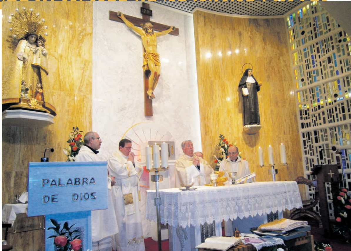
El bisbe de Lleida presideix l'Eucaristia a la capella de la residència Santa Teresa Jornet.